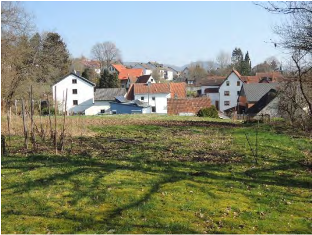
Plateau am Friedhof Blick Richtung Osten mit Nutzgarten