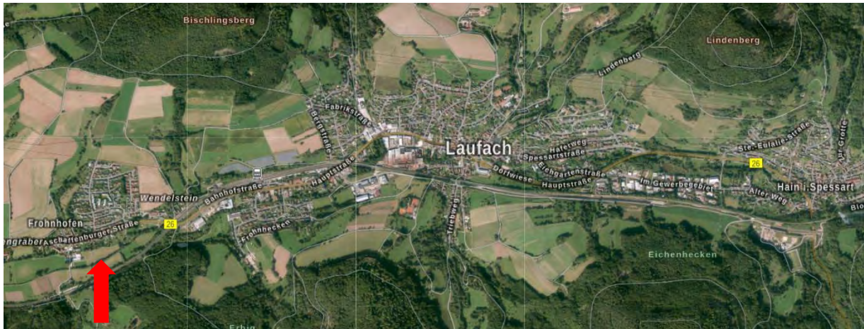
Lage im Gemeindegebiet

Der Geltungsbereich des Bebauungsplanes umfasst den historischen Altort von Frohnhofen und die sich südlich der B 26 nach Osten und Westen im Laufe der Zeit entwickelten Siedlungsbereiche. Mitten durch den Geltungsbereich verläuft die stark befahrene B 26, welche die drei Ortsteile Frohnhofen im Westen, Laufach in der Mitte und Hain im Osten verbindet.