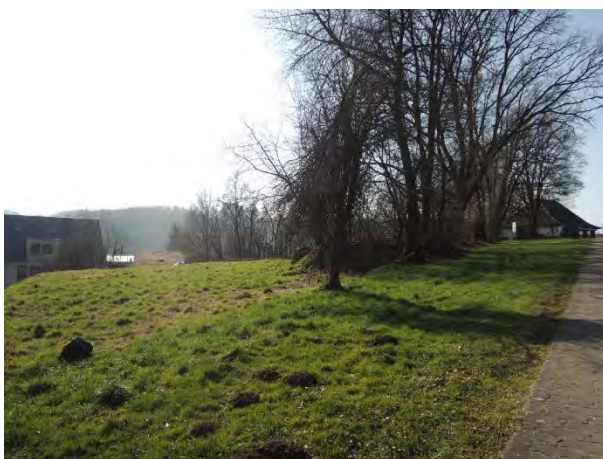
Plateau am Friedhof Blick Richtung Südwesten