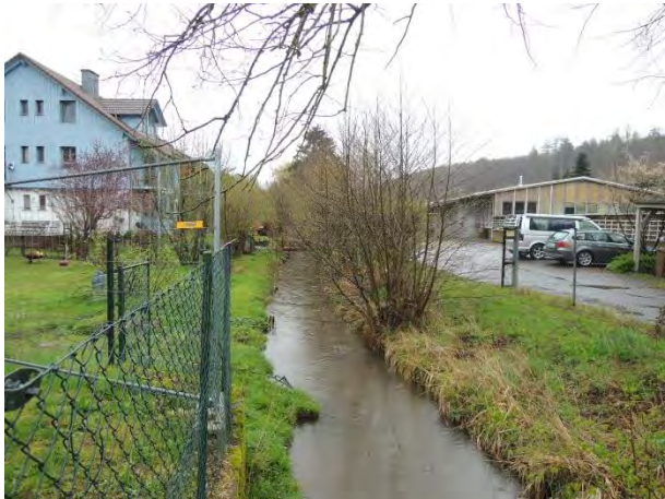
Der Uferbereich des Laufachbaches im Bereich der Brücke