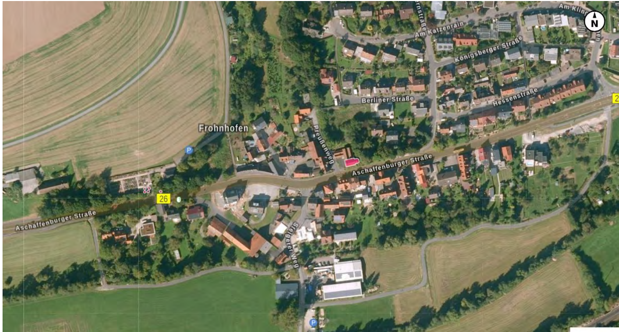
Das gleiche Gebiet heute ©Bayerische Vermessungsverwaltung

der Gemeinde als orts- und regionsfremd empfunden. Diese Bauformen sind bereits auch an anderen Stellen im Gemeindegebiet entstanden, wo man nicht rechtzeitig bauleitplanerisch tätig werden konnte.