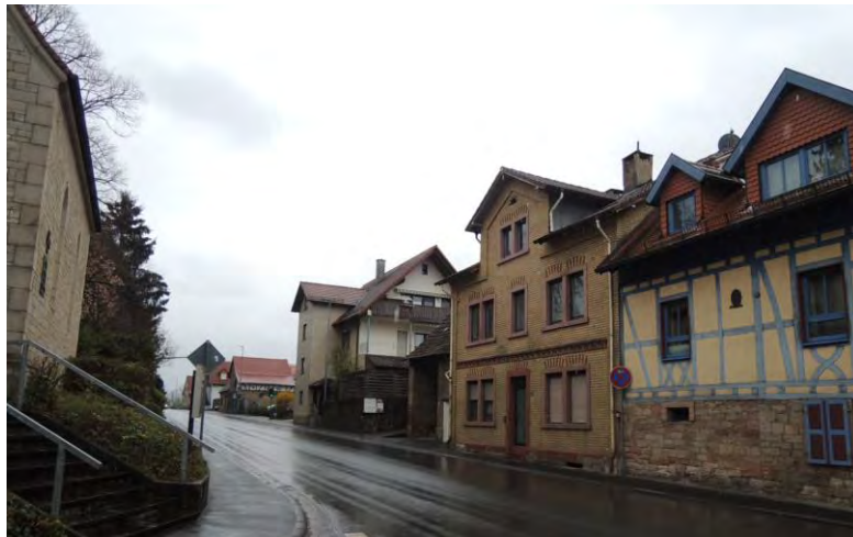
Steigerer Weg Ungerade Hausnummern 1-5 a