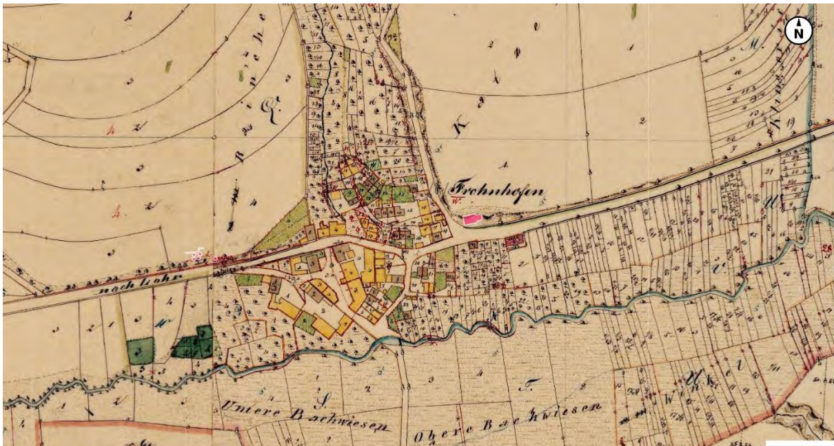
Historischer Ortskern bei der Uraufnahme

Die Gemeinde im ländlichen Raum möchte ihre eher dörfliche Struktur behalten und diese in Anpassung an zeitgemäße Bauformen weiterentwickeln. Ein ungeordnetes Durcheinander von Dachformen, Gebäudehöhen und Baukörpern soll vermieden werden. Das vorhandene Gebiet ist im Altort und östlich davon auch dadurch gekennzeichnet, dass die Baukörper nahe an der Straße stehen. Da es sich im Planbereich teilweise um ältere und unsanierte Bausubstanz handelt, steht zu befürchten, dass Gebäude abgerissen, mit mehr Geschossen und aus der Bauflucht zurückspringend errichtet werden. Dies hätte einen Verlust der Raumkanten, welche den Straßenraum bilden, zur Folge.