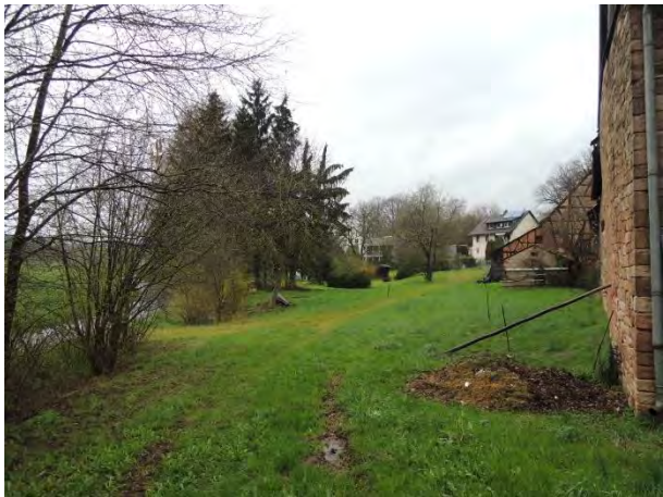
Der Uferbereich des Laufachbaches westlich der Brücke bei Feuerwehrhaus