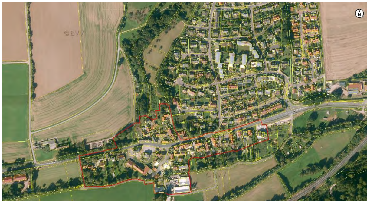
Das Plangebiet im städtebaulichen Kontext