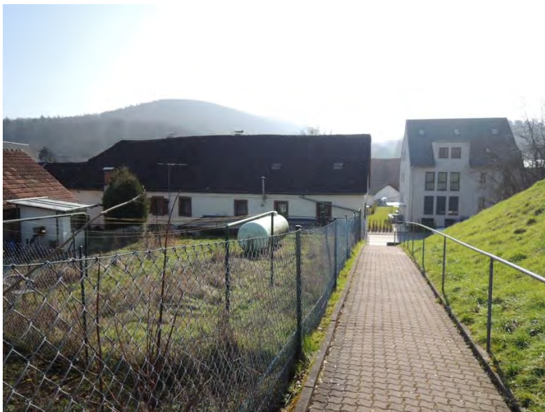
Das Brauhaus und die Bebauung hinter dem Grünzug „tauchen im Gelände ab“

Entsprechend der parallel zum Bebauungsplan aufgestellten Erhaltungssatzung soll der baurechtliche Rahmen insbesondere zu Bestandsabsicherung erstellt werden. Das ebenerdig von der Aschaffenburger Straße aus begehbare Gebäude ohne Sockel und Kniestock hat aktuell aufgrund der niedrigen Geschosshöhen eine weitaus niedrigere Wandhöhe, als es der Bebauungsplan für eine künftige Nutzung vorsieht. Die geplante Festsetzung ermöglicht bei einem Ersatzbau oder bei einem Verlust der baulichen Anlage eine zeitgemäße Bebauung mit üblichen und sinnvollen Geschosshöhen.