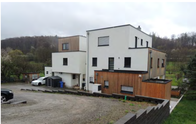
Zurückspringende Bebauung in der Aschaffenburger Straße mit Parkflächen davor