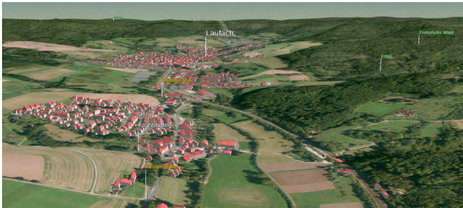
3-D-Bild mit Topographie

Die Vegetations- bzw. Biotopstrukturen setzen sich überwiegend aus Rasenflächen, Gartensträuchern und -stauden, geschnittenen Hecken sowie Einzelbäumen und kleineren Baumgruppen zusammen. Der entlang des Plangebiets fließende Bach erhöht die vorhandene Arten- und Biotopvielfalt und führt das oberflächlich anfallende Niederschlagswasser ab.