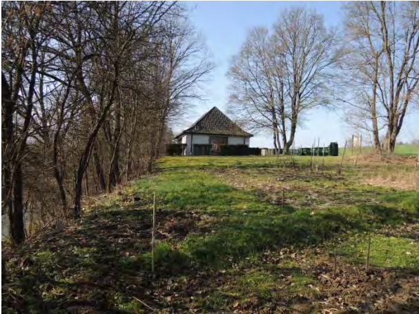
Plateau am Friedhof Blick Richtung Westen