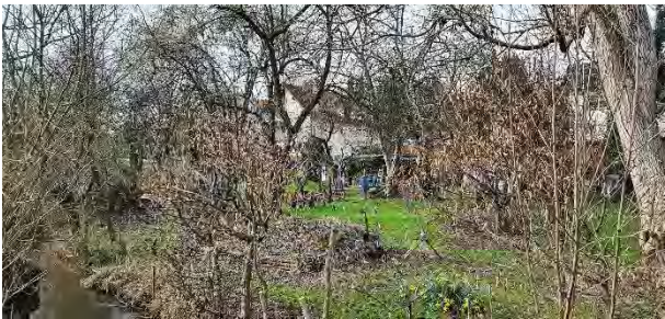
Der Uferbereich des Laufachbaches, Privatgärten östliches Plangebiet